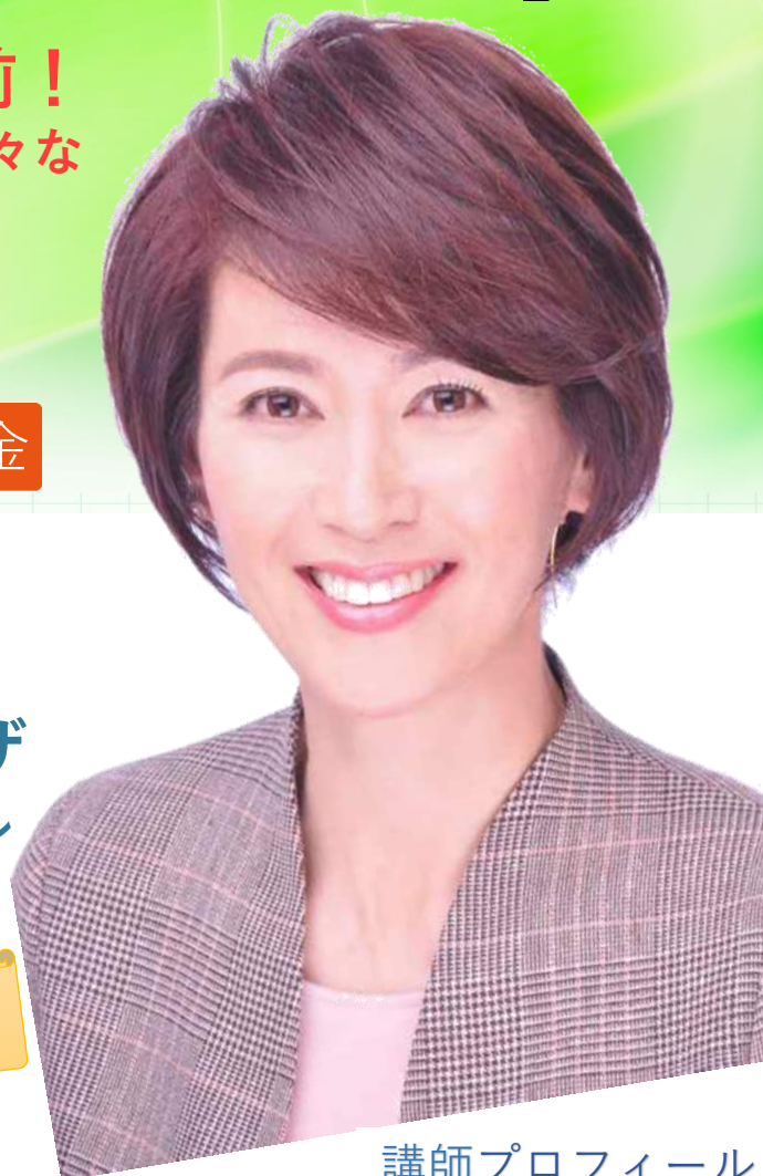
講師プロフィール

※記念講演会入場には、 整理券が必要となります。 裏面申込書に必要事項を記入し、 下記へお申込み下さい。